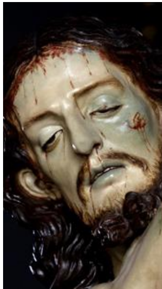
Figura 6.:Cristo de Torcuato Ruiz del Peral.