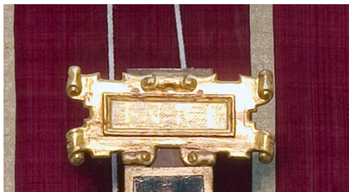
Figura 7: INRRI