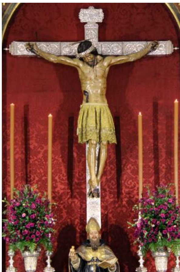
Figura 2: Cristo de San Agustín, Granada.

De igual modo la imagen del Cristo Crucificado irá acompañada de un busto relicario a sus pies del Santo Agustín.