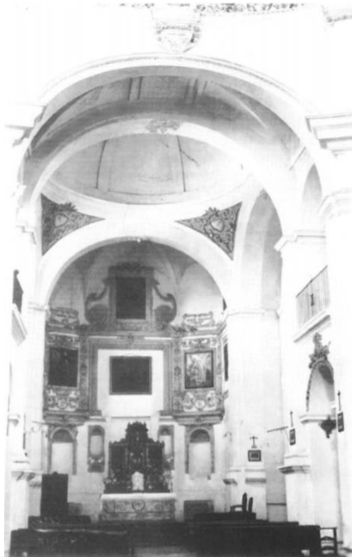
Figura 1: Interior del antiguo convento.

La edificación del convento y fábrica de la iglesia se producen durante el siglo siguiente. Fray José Láñez, obispo de Guadix entre 1653 y 1667, agustino exclaustro, renueva el convento de san Agustín construyendo la iglesia y parte del convento. (Figura 1)